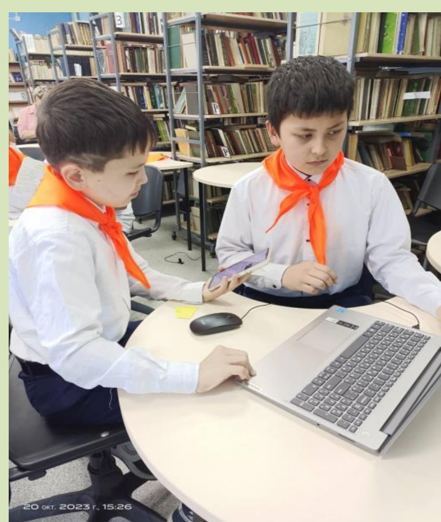
Игра «Холмогорский вундеркинд»