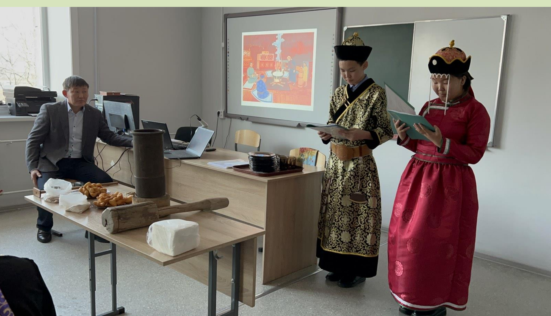
Ученики в красочных костюмах представили свою национальность, спели песню на бурятском языке, а затем перевели на русский язык.